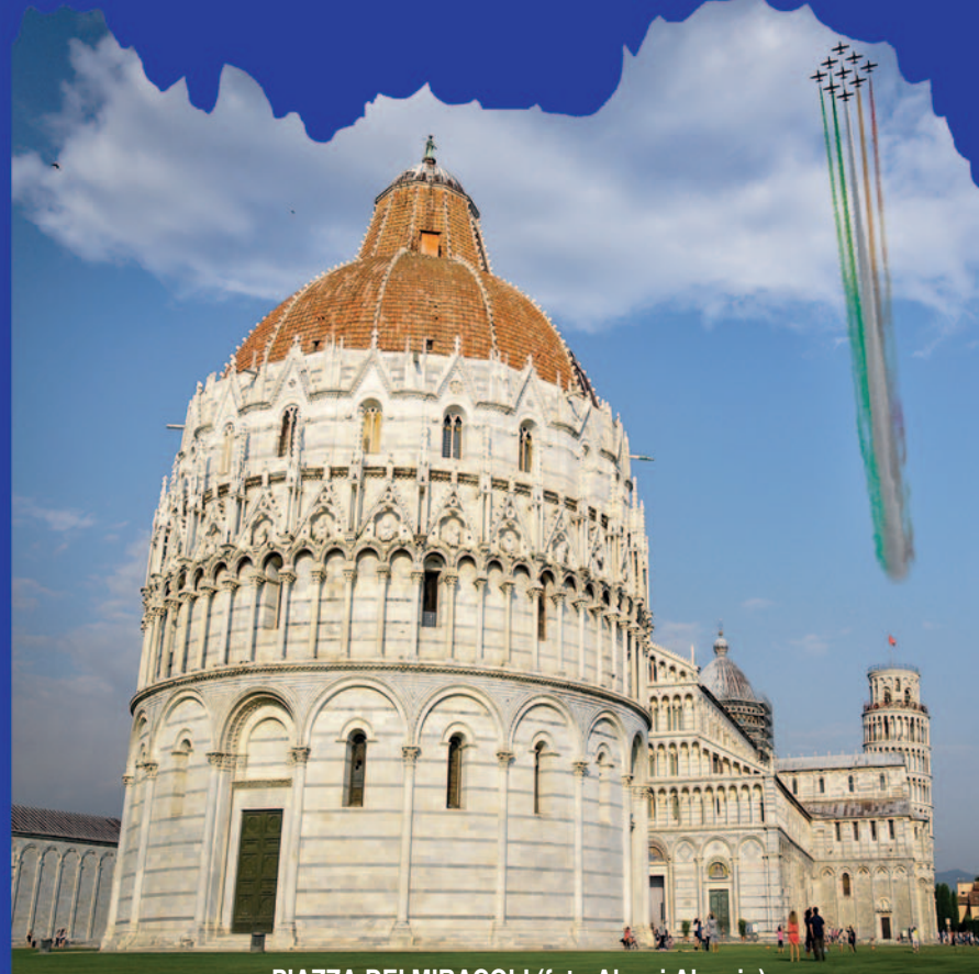
PIAZZA DEI MIRACOLI