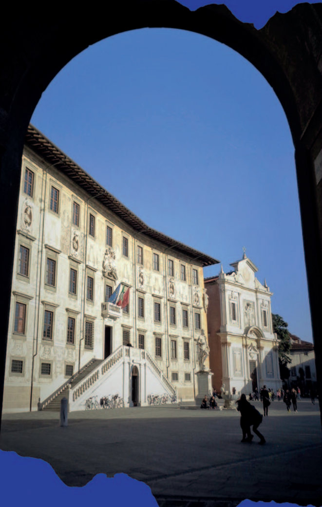
SCUOLA NORMALE SUPERIORE e CHIESA DEI CAVALIERI DI SANTO STEFANO