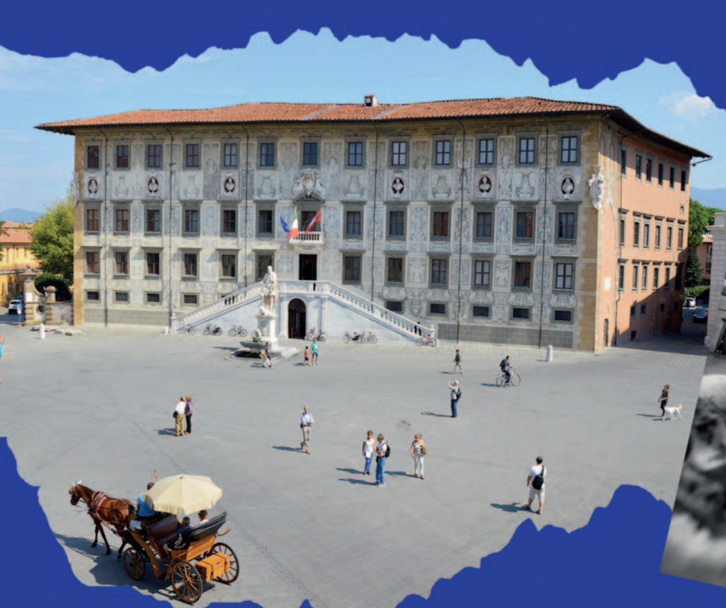
SCUOLA NORMALE SUPERIORE e LA STATUA DI COSIMO I DE' MEDICI