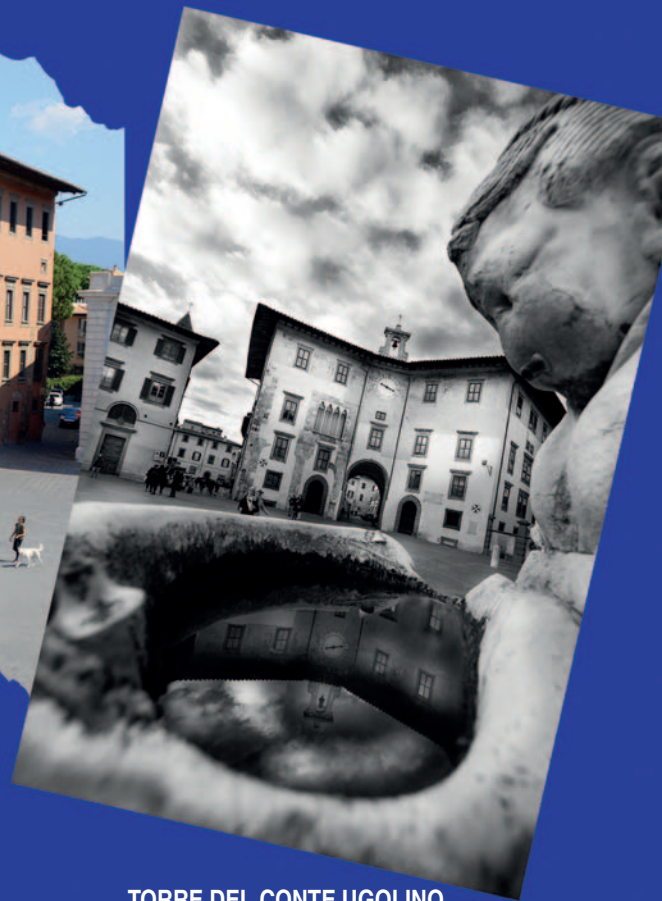
TORRE DEL CONTE UGOLINO all'interno del Palazzo dell'Orologio in Piazza dei Cavalieri