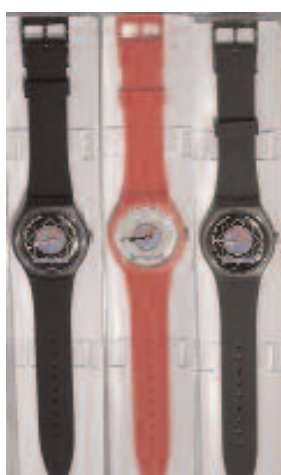
OROLOGI NERO / ROSSO / VERDE