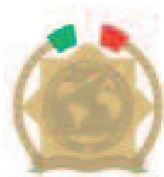
SPILLA DA GIACCA SEZIONE ITALIANA MODELLO 1