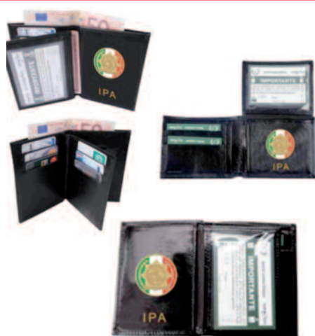
PORTAFOGLIO/PORTAPLACCA VARI MODELLI