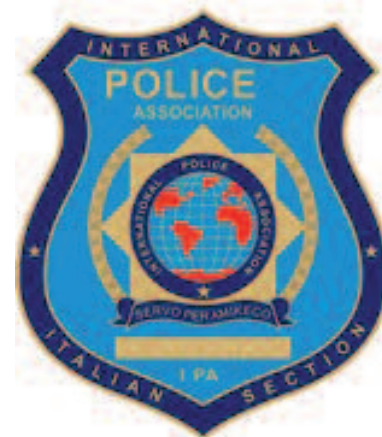
Placca 2 livelli coniata in metallo h. 70 mm – spess. 2 mm