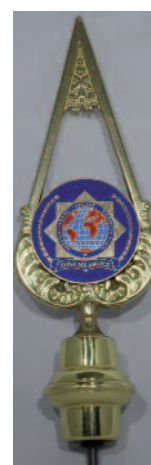
PUNTALE PORTA LABARO