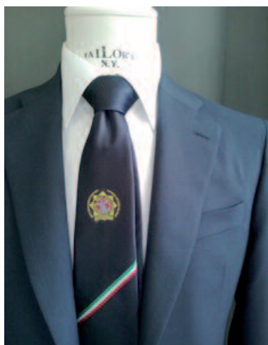
CRAVATTA SEZIONE ITALIANA