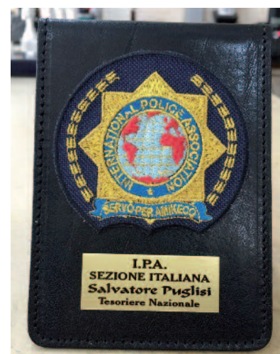
PLACCA DA TASCHINO