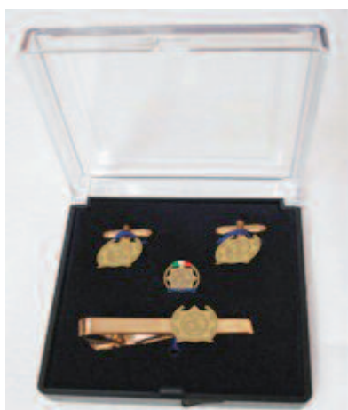
BOX CON GEMELLI, FERMACRAVATTA, SPILLA