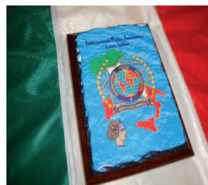
Targa personalizzabile in pietra lavica