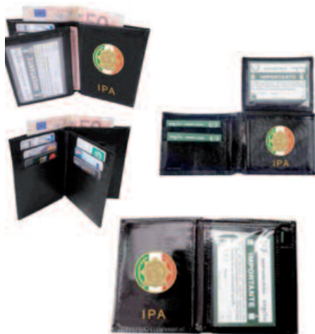
PORTAFOGLIO/PORTAPLACCA VARI MODELLI