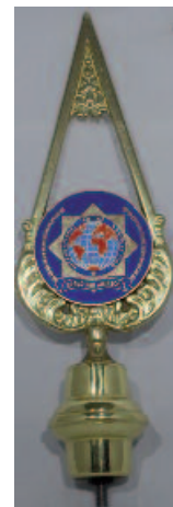
PUNTALE PORTA LABARO