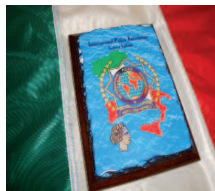
Targa personalizzabile in pietra lavica