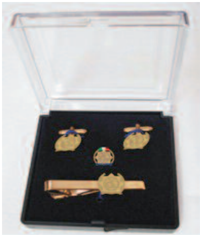
BOX CON GEMELLI, FERMACRAVATTA, SPILLA