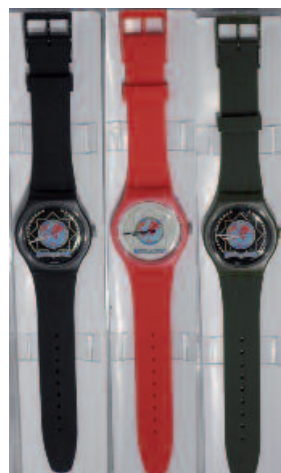
OROLOGI NERO / ROSSO / VERDE