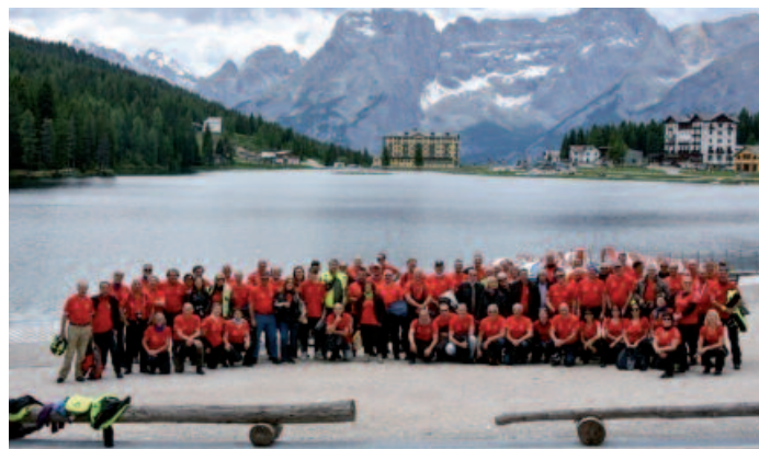
Lago di Misurina

Civili e Militari intervenute prima della cena dove si sono svolti i ringraziamenti delle varie delegazioni straniere ed italiane, con scambio di doni, di saluti e di arrivederci in tutte le lingue.