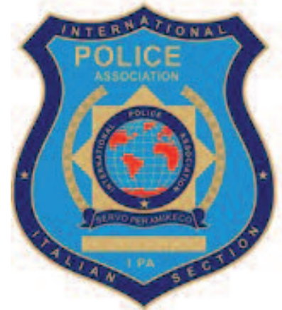
Placca 2 livelli coniata in metallo h. 70 mm – spess. 2 mm