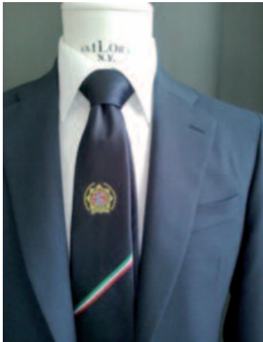
CRAVATTA SEZIONE ITALIANA