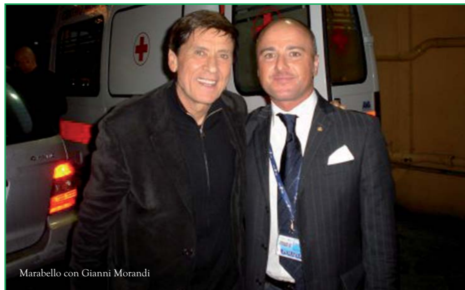
Marabello con Gianni Morandi

per quanto riguarda i transiti nella frontiera che aumentano notevolmente in occasione dell'evento canoro.